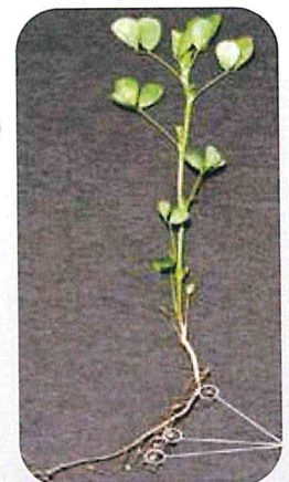
Nitrogen fixing nodules

*Alfalfa grows best in well drain soils with a neutral pH of about 7