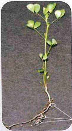
عقد - تثبيت النيتروجين

* تنمو الفالفا بشكل أفضل في تربة جيدة الصرف مع درجة حموضة متعادلة حوالي 7