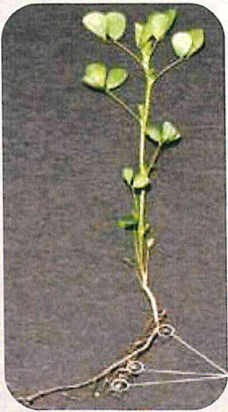
عقد - تثبيت النيتروجين

* تنمو الفالفا بشكل أفضل في الأرض جيدة الصرف مع درجة حموضة متعادلة حوالي 7