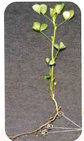
Nitrogen fixing nodules

*Alfalfa grows best in well drain soils with a neutral pH of about 7