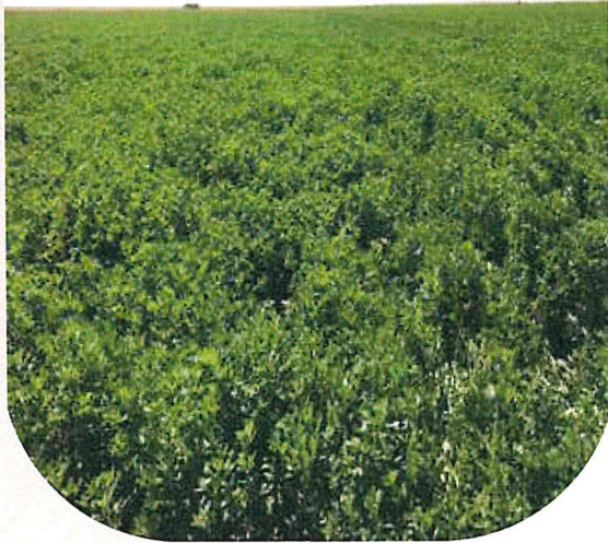
صورة الصنف SW10

بذور الصنف بجودة عالية ( 5 نجوم ) و معتمد لدى الجمعية الأمريكية لتوزيع البذور المعتمدة AOSCA *البذور تعامل مسبقاً بـ: